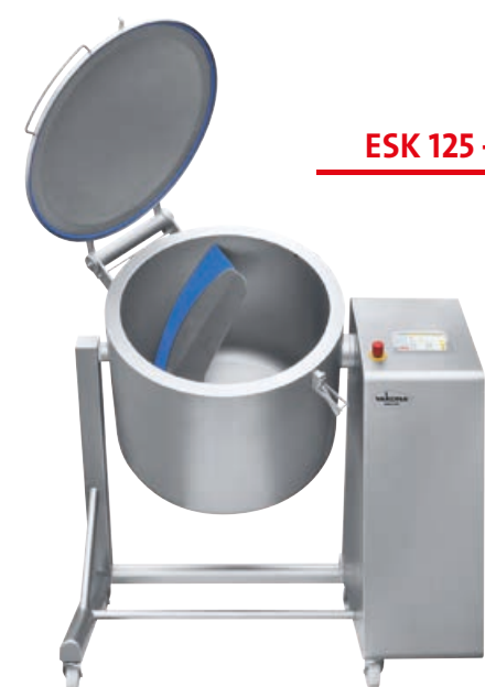
ESK 125 – 250 STL

The machines captivate with a high user friendliness which is achieved by a plain handling and easy cleaning. A high individualization of the machines is reached by a wide range of equipment options, in order to achieve the highest possible degree of customer-specific product optimization.